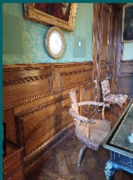
Le château de BOUGES et son fauteuil spécial "queue de pie."