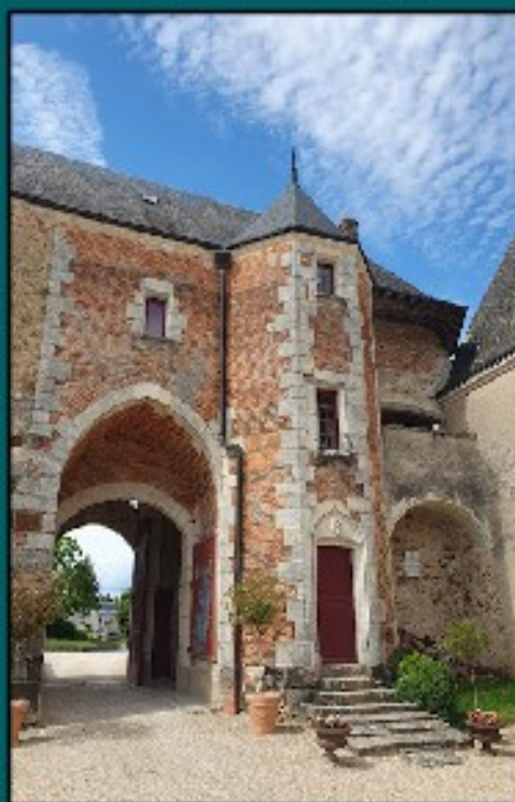
Alain Fournier et la Chapelle d'Angillon