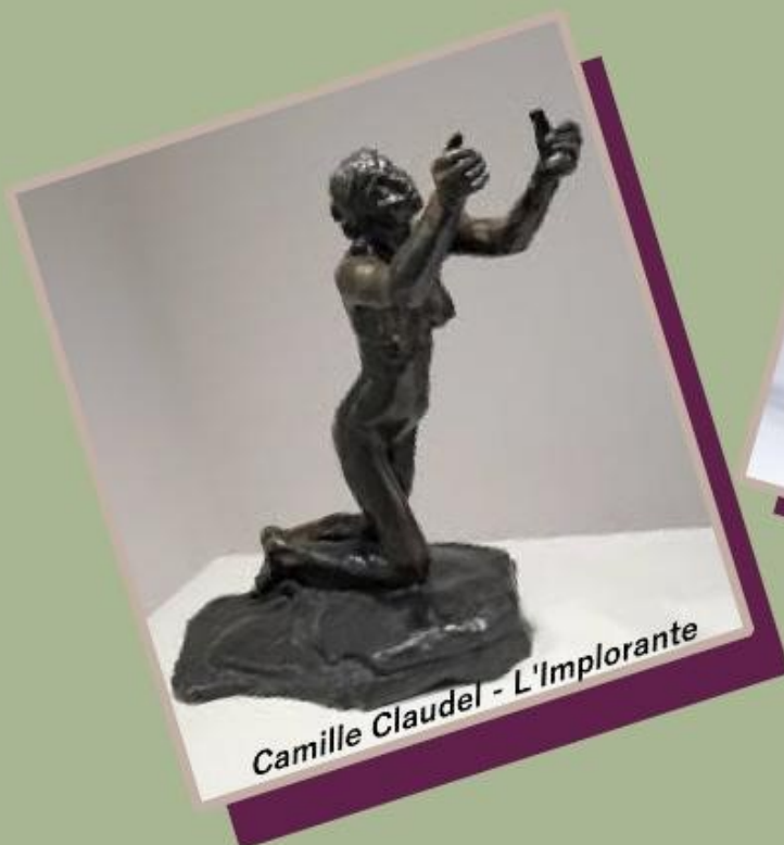
Camille Claudel - L'Implorante