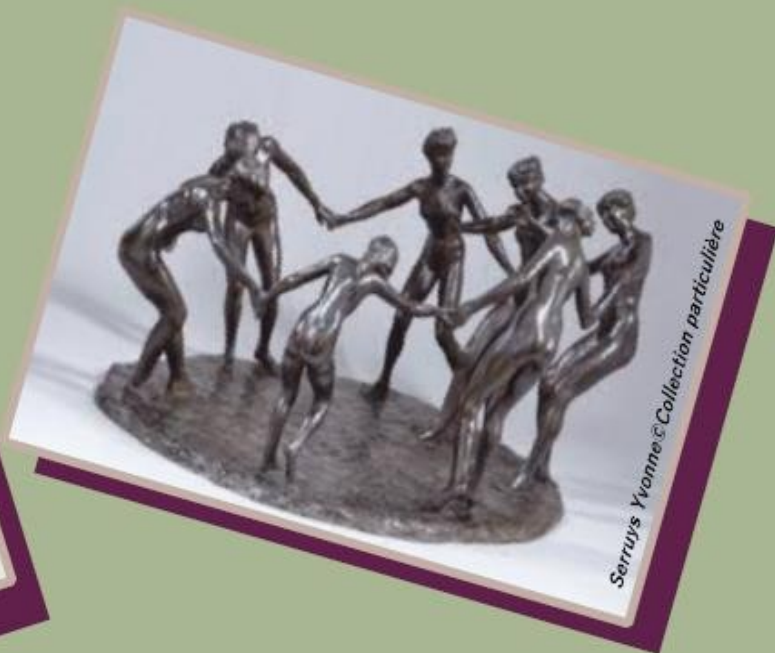
Serruys Yvonne Collection particulière