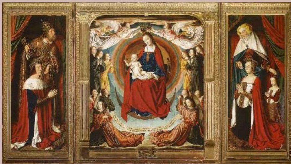
Jean Hey, le Maître de Moulins