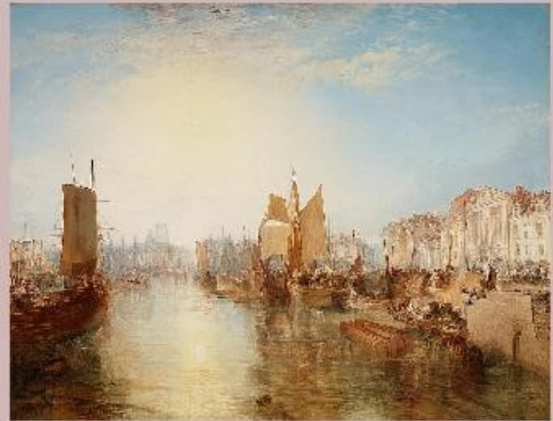
Constable et Turner